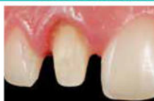
Συγκόλληση άξονα/ Ανασύσταση κολοδώματος