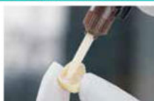
Συγκόλληση έμμεσων αποκαταστάσεων